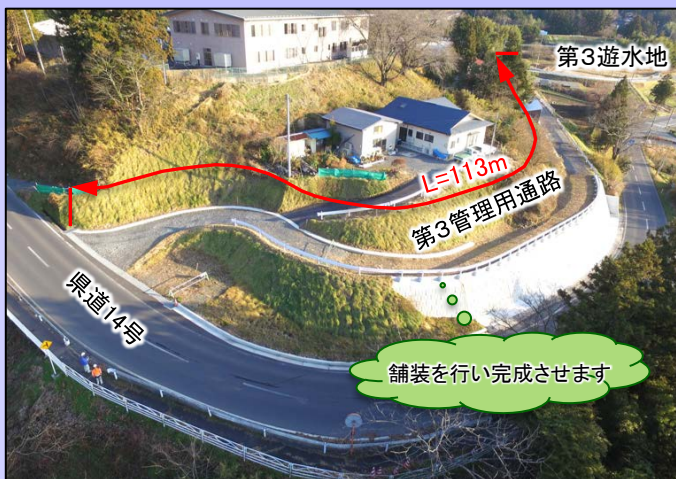
【舞川地区全景】施工前