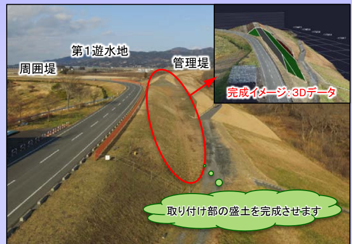
【中里地区全景】施工前

◆◆編集後記◆◆ 暦の上では、春が始まっていますがまだまだ雪の降る寒い日が続きます。今週初めも荒れた天気になり、事故が多発していました。車間距離を十分にとり安全運転に心がけましょう (よ)