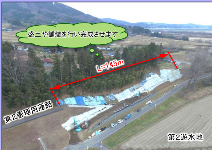
【長島地区全景】補強土壁施工中