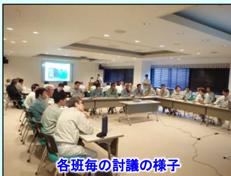
各班毎の討議の様子