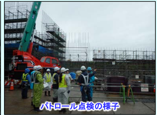
パトロール点検の様子