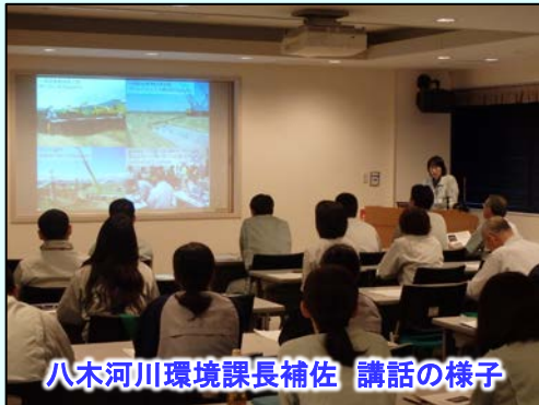
八木河川環境課長補佐 講話の様子