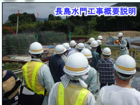
長島水門工事概要説明