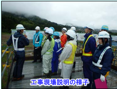
工事現場説明の様子