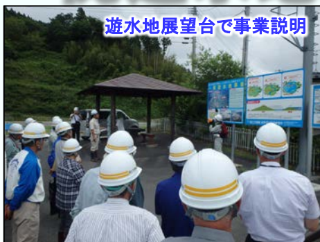
遊水地展望台で事業説明

遊水地地権者会で、遊水地展望台や長島水門、大林水門工事現場の見学が行われました。参加者は、岩手河川国道事務所 一関出張所職員の話に熱心に聞いていました。