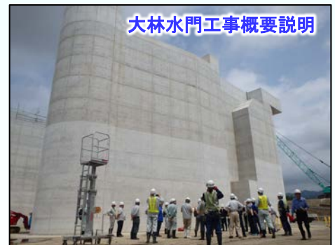
大林水門工事概要説明

◆◆編集後記◆◆ 今年もあっという間に半年が過ぎました。そう思えるのも、身も心も健康で過ごせているおかげです。健康第一！大好きな肉料理を食べて♪がんばります(∩o∩) (す)