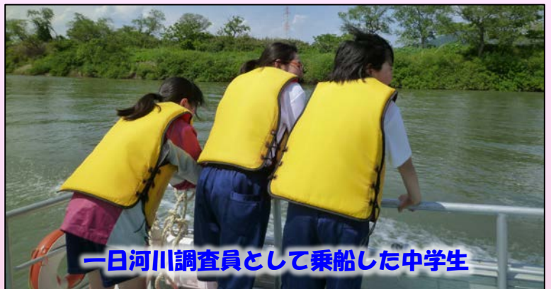
一日河川調査員として乗船した中学生

◆◆編集後記◆◆ 今週末は桜が満開になり、お花見が出来そうですね(^o^) 桜はあっという間に散ってしまいますが、すぐに来年の準備に入ります。継続が大事なんですね☆(ゆ)