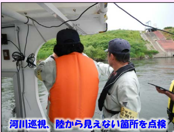
河川巡視、陸から見えない箇所を点検

岩手河川国道事務所 一関出張所では、河川調査船『ゆはず』を利用して北上川の巡視や河川の環境調査など、陸からでは確認出来ないような箇所の点検を行っています。また、北上川の自然や環境について知っていただくために一日河川調査員として『ゆはず』に乗船し河川調査を行っていただく活動も行っています。