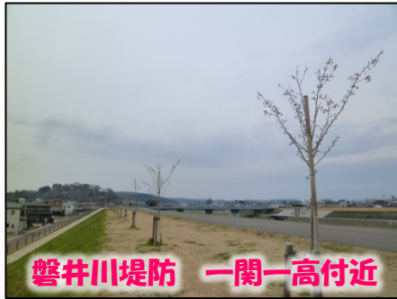
磐井川堤防 一関一高付近