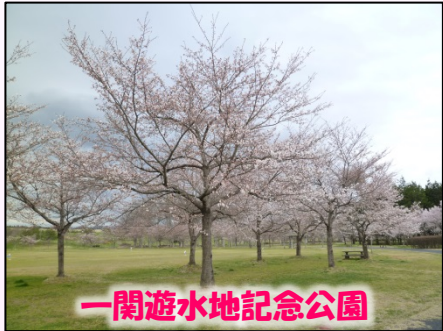
一関遊水地記念公園