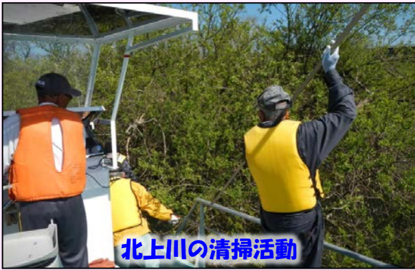
北上川の清掃活動