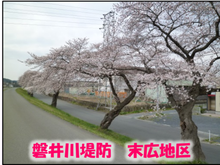
磐井川堤防 末広地区