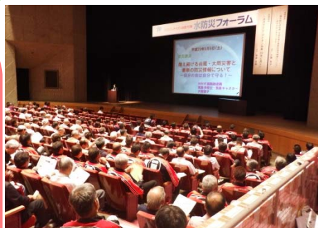
約700名の参加者が会場に詰めかけた