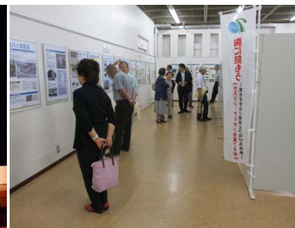
一関の今昔写真や国、県、市による治水事業の歩みや施設の機能についてパネル展を開催