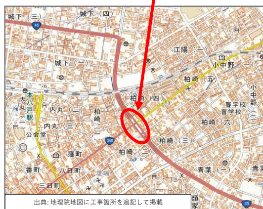
ここが塩町トンネルです