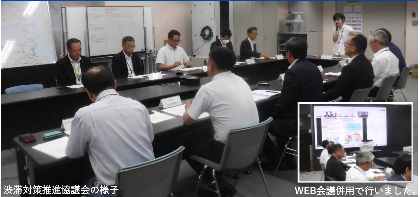
渋滞対策推進協議会の様子