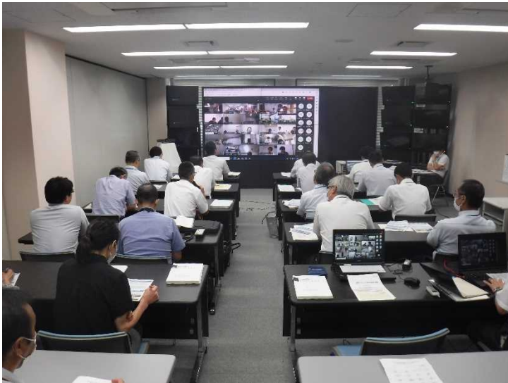
▲会議状況(青森河川国道事務所 災害対策室)

令和5年9月5日、青森河川国道事務所災害対策室をメイン会場として計2会場で開催し、国・県・市町村等の道路管理者69名が参加しました。