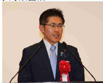
▲事務所長による事業説明 ▲木村次郎衆議院議員の挨拶