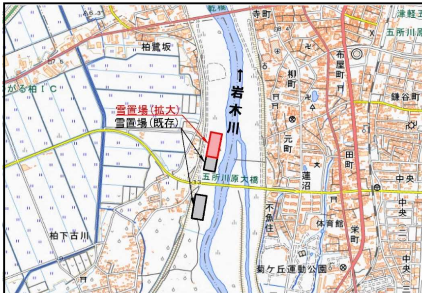
地理院地図に雪置場等を追記して掲載