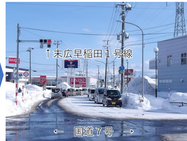
スクラム除雪後(末広早稲田1号線)