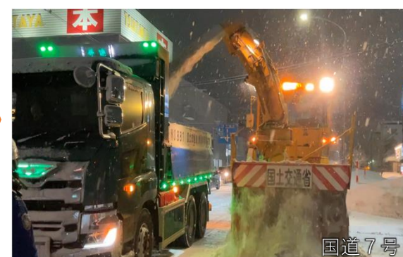
③ロータリー除雪車でダンプトラックに積み込み