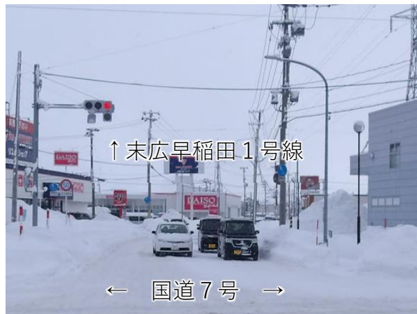
スクラム除雪前(末広早稲田1号線)