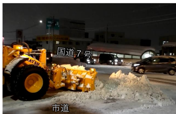
②国道7号に掃き出し