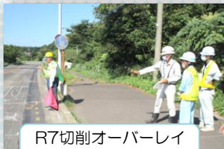
R7切削オーバーレイ の現場