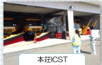
本荘ICST 除雪機械がズラリ

どの現場でも熱心にお話を聞いておられたインターンの生徒さん、たいへんおつかれさまでした。今回の体験で、国土交通行政にさらに興味を持っていただけたらうれしいです。