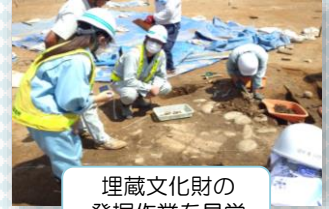
埋蔵文化財の 発掘作業を見学