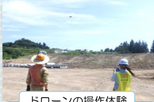
ドローンの操作体験

8月25日(火) 秋田工業高等専門学校生徒さん1名がインターンシップにより本荘地区監督官室と本荘国道維持出張所を訪れ、国土交通省の現場の仕事を体験されました。午前には現在進行中の遊佐象潟道路の工事現場や埋蔵文化財の発掘現場を見学し、午後は本荘国道維持出張所管内の道路維持管理の現場等を見学しました。