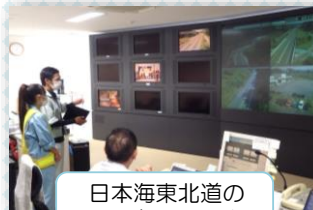
日本海東北道の モニタールーム