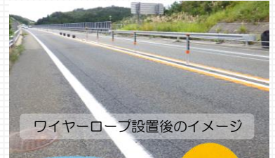
ワイヤーロープ設置後のイメージ