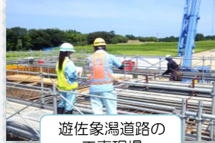
遊佐象潟道路の 工事現場