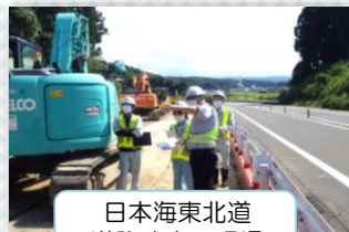
日本海東北道 道路改良の現場