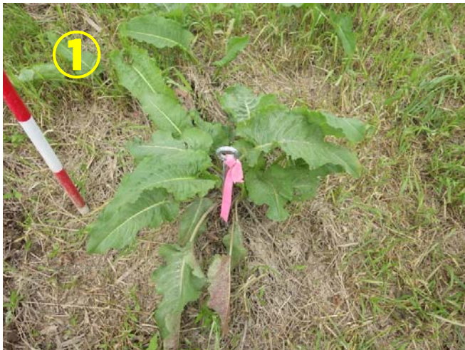
植生状況。目印としてピンを打っています。

2012年の環境省レッドリストでは絶命危惧II類(VU)になっているとても貴重な植物です。現在では河川の変化や外来植物の影響により、その数は激減したそうです。 湿った草原を好み、大きくなると80～120cmにもなるそうです。