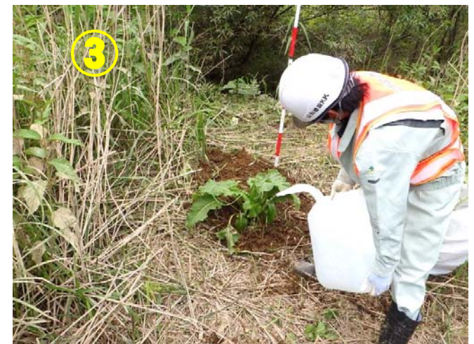
水を流し込んでしっかりと埋めます。 場所は秘密。

懸命に生きている絶滅危惧植物から元気をもらい、夏の暑さに負けず、現場での活動をがんばります！！