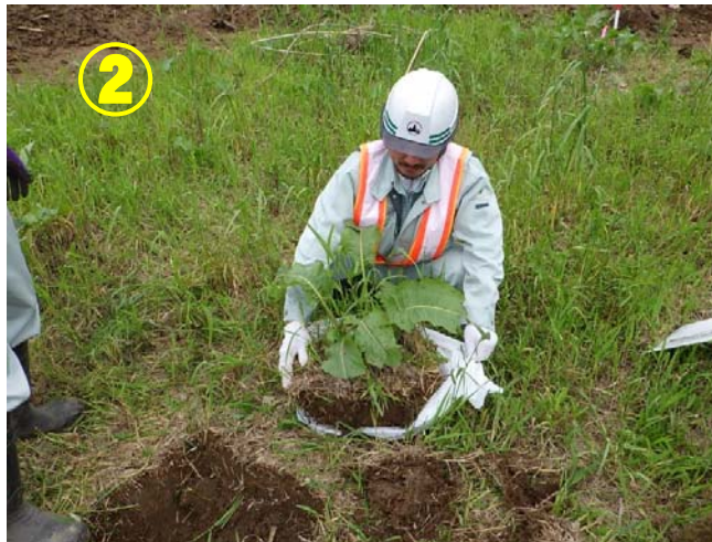
根や葉を傷めないように掘り起こします。