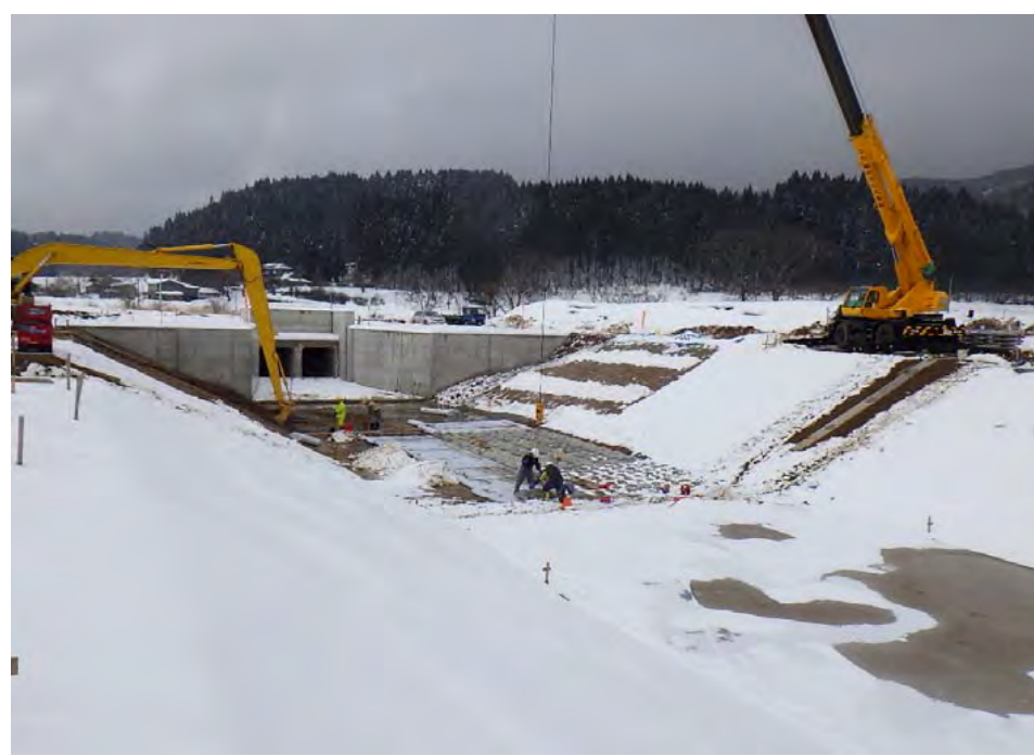
ブロック据付け状況