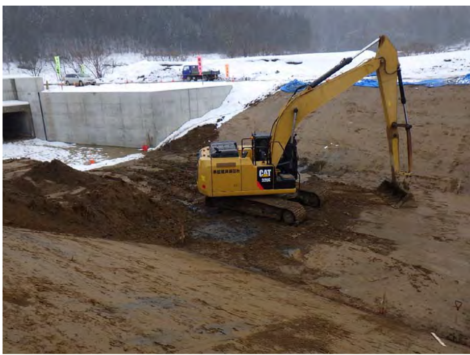
堤外水路掘削状況

地域の皆様方には、日頃より私どもの工事に対しましてご理解とご協力を頂き誠に感謝致します。 現在、工事は函体の埋戻しが完了し堤外水路の掘削、ブロック据付け作業を行っています。 本施工は2月いっぱいまで完了し、3月には片付けを行い終了の予定です。 工事も終盤に入ってきました、今後も無事故で完成できるよう努力しますので、今後ともよろしくお願いいたします。