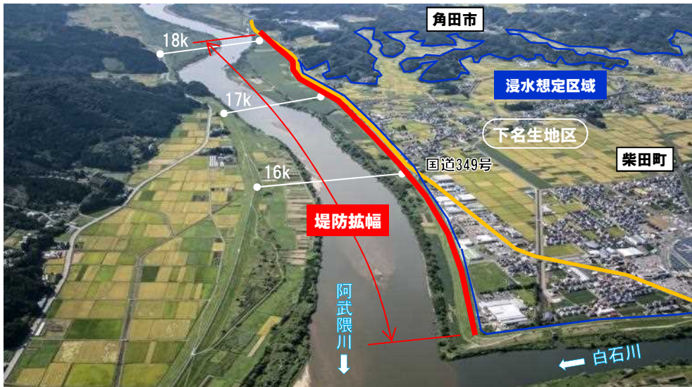
▲阿武隈川下流 下名生地区(柴田郡柴田町下名生～角田市江尻地先) しものみょう しばた しばた しものみょう かくだし えじり