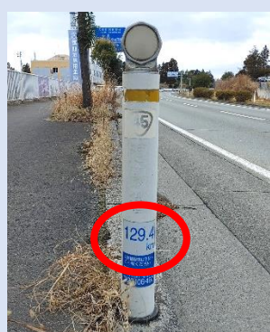
シールで小さく主張