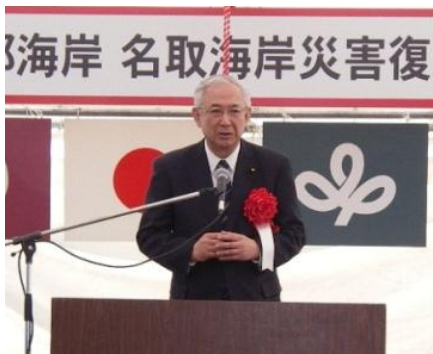
井上 義久 衆議院議員