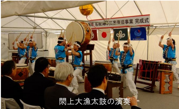
閑上大漁太鼓の演奏

式典の始まりに閑上太鼓保存会の皆さんが「閑上大漁太鼓」の演奏をしていただきました。