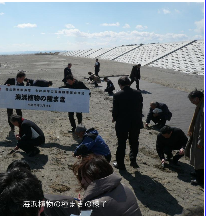
海浜植物の種まきの様子