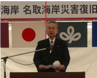
佐々木 一十郎 名取市長