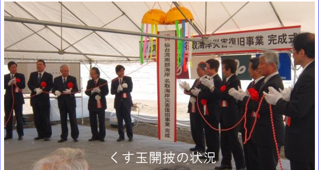
くす玉開披の状況

名取海岸の災害復旧事業の完成を祝い出席者によるくす玉の開披が行われ盛大な拍手に包まれました。