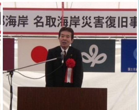
中野 正志 衆議院議員