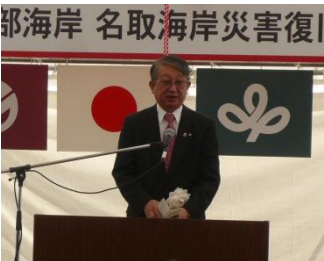
三浦 秀一 宮城県副知事