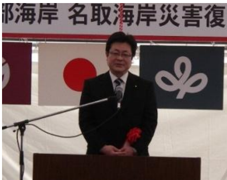
西村 明宏 衆議院議員

また、仙台河川国道事務所長から仙台湾南部海岸堤防復旧事業経過報告で、名取市と連携した取り組みや工夫などの説明を行いました。