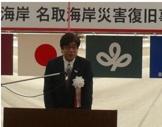
土井 亨 国土交通大臣政務官