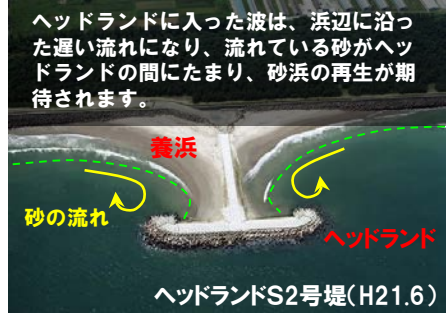
ヘッドランドS2号堤(H21.6)

天然の岬に囲まれた海岸では、岬の地形により流れが屈折し、波の力を弱め安定した砂浜が維持されます。ヘッドランドはこのような地形を人工的に造って砂浜を守ります。