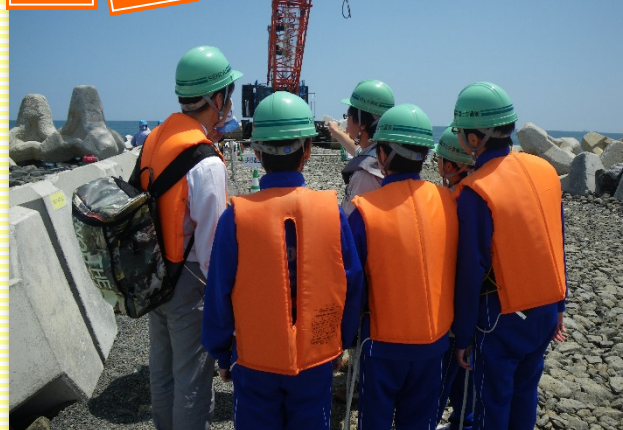
▲ヘッドランド整備工事について説明を受ける様子