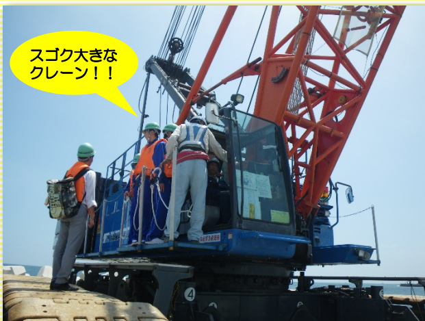
▲大型クレーンに搭乗体験