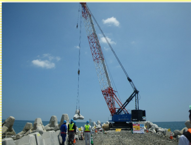
▲S1号ヘッドランド整備工事現場