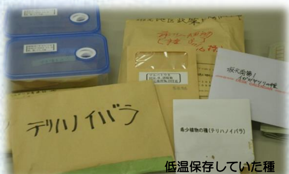
低温保存していた種