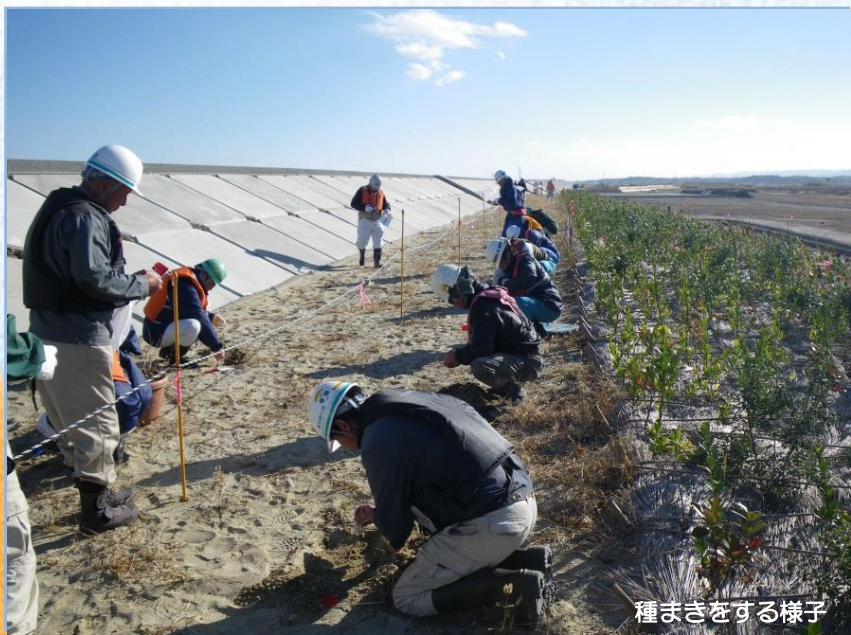
種まきをする様子

種は、堤防工事範囲内に自生していた海浜植物の種を採取したもので、仙台海岸出張所で低温保存し大事に保管してきたものです。無事に芽が出ることを願って今後見守っていきたいと思います。