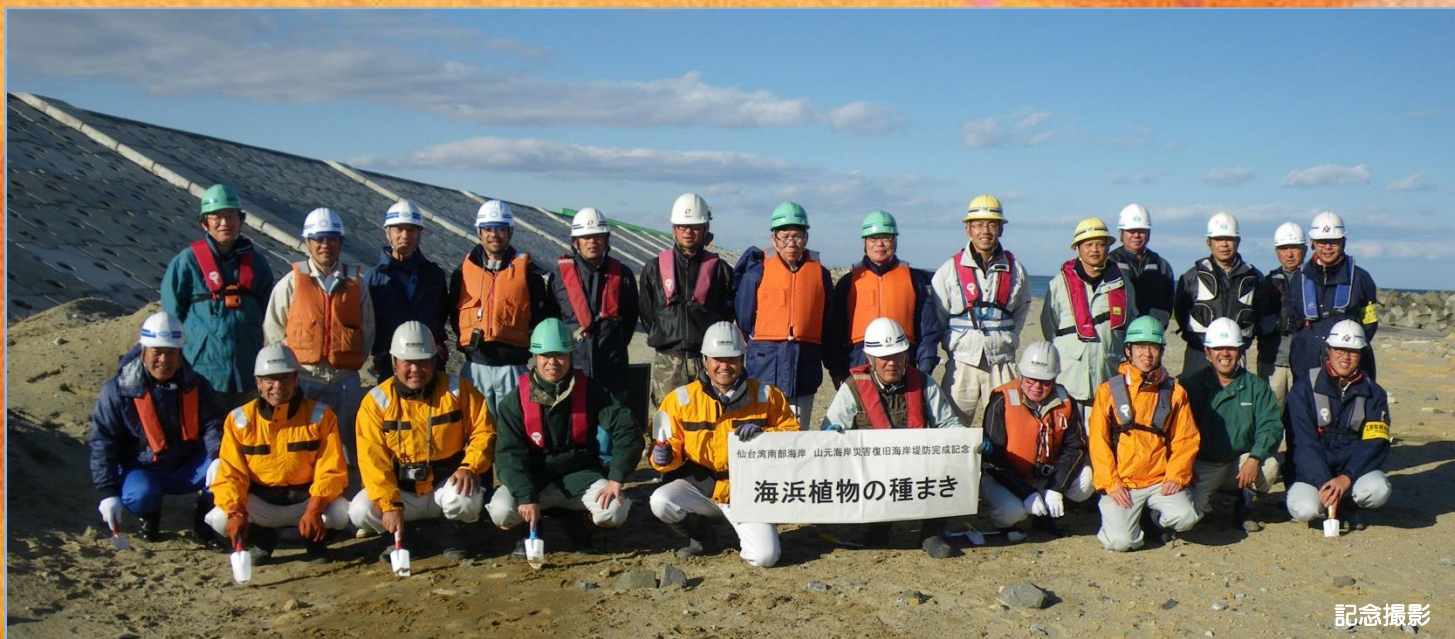
仙台湾南部海岸 山元海岸災害復旧海岸堤防完成記念