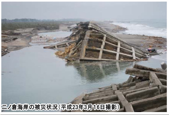
三ノ倉海岸の被災状況(平成23年3月16日撮影)

震災当時、私は仙台空港近くの工事を担当していました。地震直後、ラジオの情報で大津波警報が発令になったことを知り、作業員に避難指示を出し、自分もそのまま避難して全員無事でしたが現場事務所は全壊となり、書類、パソコンは水没し使えなくなっていました。