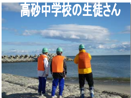
高砂中学校の生徒さん

平成22年11月10日（水）に高砂中学校の2年生の生徒さん2名が、そして11月26日（金）には郡山中学校の2年生の生徒さん3名が職場体験の中で、仙台海岸出張所の仕事についても学びました。仙台海岸出張所の業務内容を説明した後、山元海岸にあるS4号ヘッドランへ行き、ヘッドランドの役割や仕組み、その効果について学習しました。