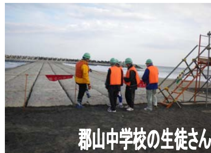
郡山中学校の生徒さん