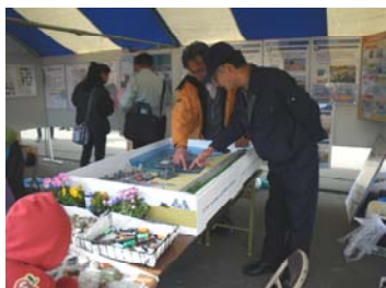
ヘッドランドについて 説明中。。。。