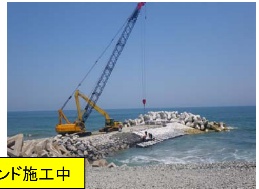
S5号ヘッドランド施工中

平成21年度より、S5号ヘッドランド(突堤・人工岬)がはじまりました。ヘッドランドは大規模な構造のため、3年～4年かけて工事が施工されます。