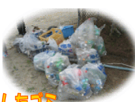
海岸で回収したゴミ

平成22年6月8日(火)に山下第二小学校の1年生~6年生の生徒さんと地域の方々、約250名で笠野海岸で清掃活動を行いました。