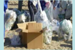
小浦で収集したゴミ