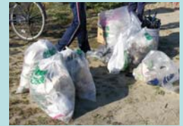
磯浜海岸で収集したゴミ