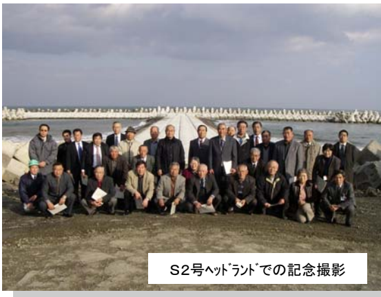
S2号ヘッドランドでの記念撮影

12月10日(水)、名巨公衆衛生組合連合会役員の方々が、ヘッドランド整備・養浜工によって少しずつ砂浜が回復している山元海岸の見学会に訪れました。