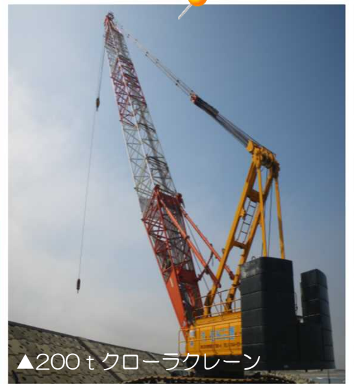
▲200tクローラクレーン

この体験を通して学んだことを、子供たちの将来のために役立ててもらえれば幸いです。