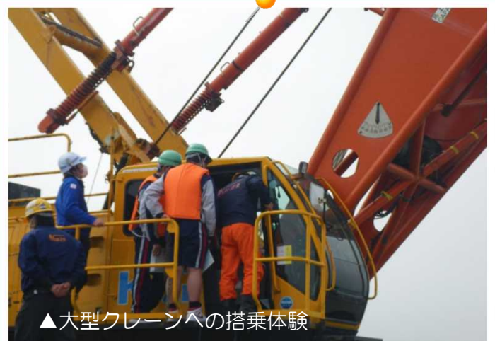
▲大型クレーンへの搭乗体験