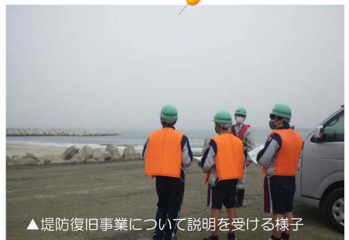
▲堤防復旧事業について説明を受ける様子

実際に大型クレーンに搭乗してもらい、クレーン車のカメラによる状況確認や、操作スイッチについての説明などを学びました。