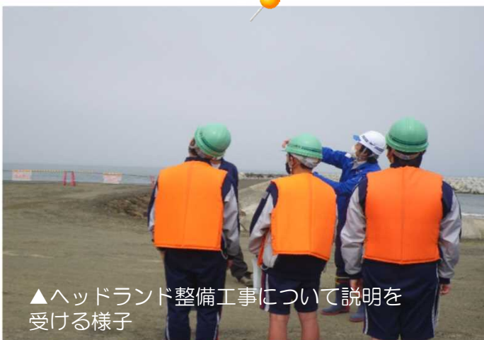
▲ヘッドランド整備工事について説明を受ける様子