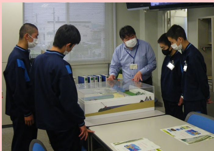
▲模型を使って役割を学んでいる様子