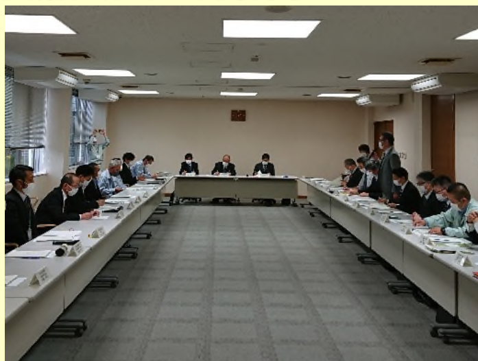
▲意見交換会の様子

管内で実施している河川・海岸事業に関する情報や、各自治体が抱える懸案について話し合うとともに、防災・減災の取り組みとして、より広い地域で水害対策を講じる「流域治水」に関する制度や、各事業における連携についての認識を深めました。