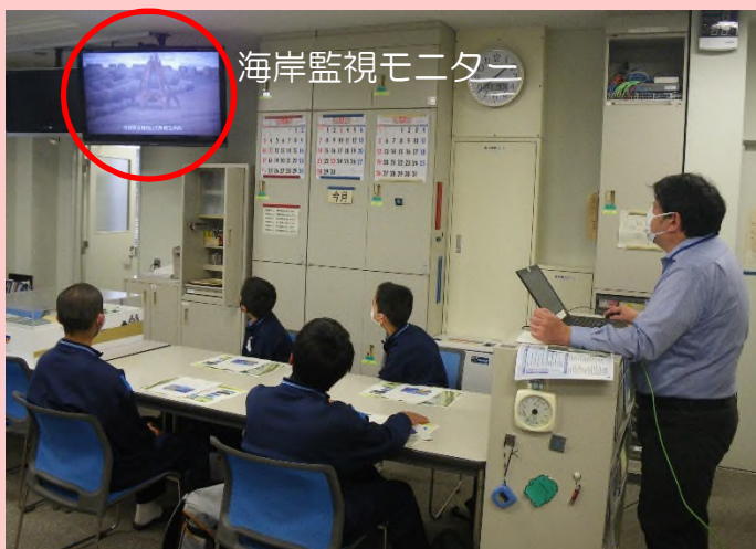
▲モニターを見ながら説明を受けている様子

当日は雨だったため、出張所内で事業概要の説明や海岸監視モニターを見ながら現場の説明を行いました。また、ミニチュア模型を使って、防潮堤やヘッドランドの役割を学びました。現場に行けず、実物の大きさや迫力を感じてもらえなかったのが残念ですが、これを機に、国土交通省の仕事に興味を深めてもらえたら嬉しいです。