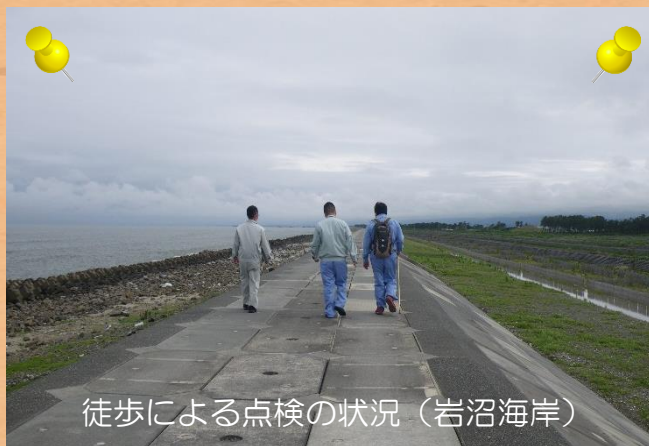
徒歩による点検の状況（岩沼海岸）