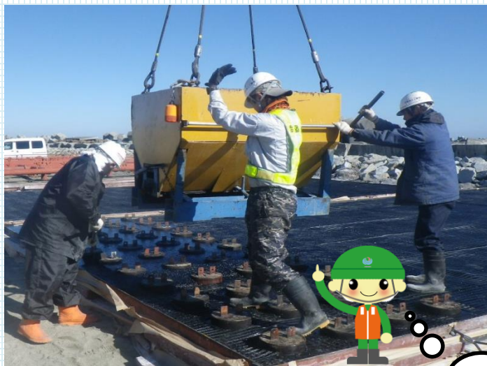
▲アスファルトマット製作中

現在、ヘッドランド先端部分の工事を行っており、アスファルトを板状の型に流し固めマットを製作し、海に沈めその上に消波ブロックを設置する作業をしています。