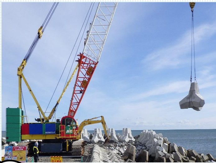
▲既設消波ブロック撤去