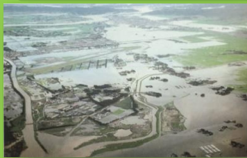
増田川から岩沼方向