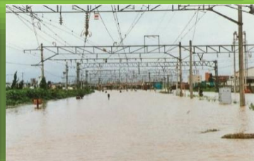
岩沼駅構内