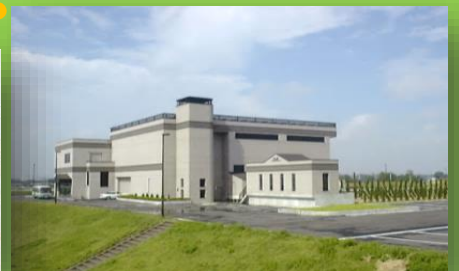
押分排水機場(ポンプ場)