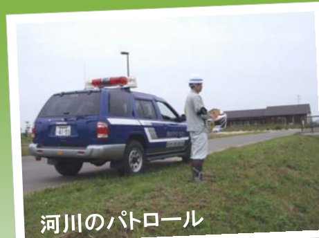
河川のパトロール