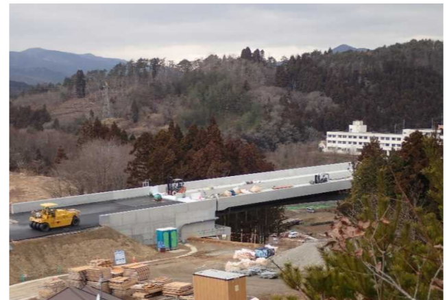
▲No285から終点側を望む [大峠山橋(仮)]