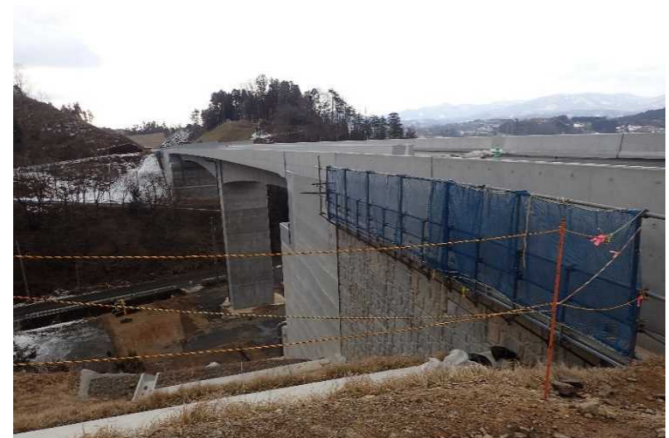
▲No271から終点側を望む [鹿折橋(仮)]