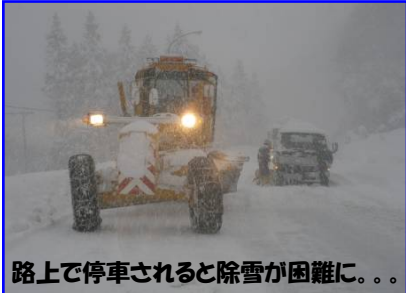
路上で停車されると除雪が困難に。。

仙台西国道維持出張所では、冬期通行障害を防ぐため、除雪や凍結抑制剤の散布を行っています。