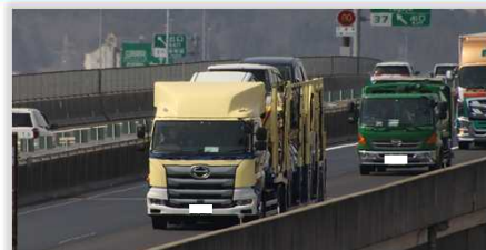
▲『ぐるっ都・仙台』を走行する組立自動車の輸送