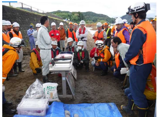
【実演・展示：メーカーによる】