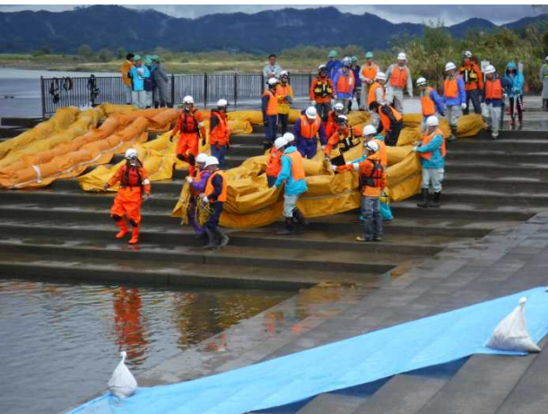
【オイルフェンス展張：送り出し】