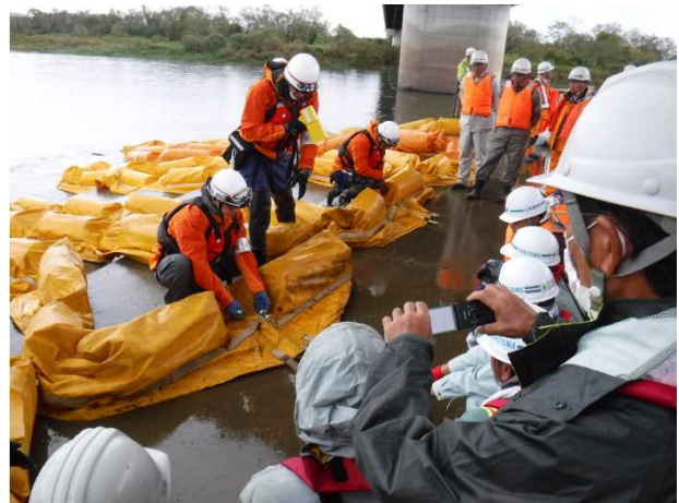
【基礎講習：オイルフェンス繋ぎ合わせ】