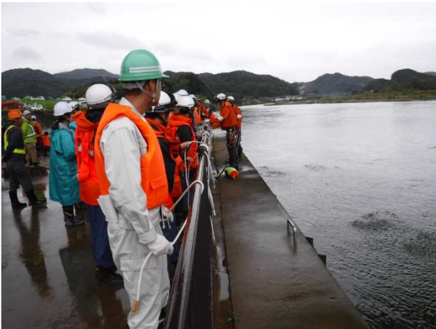
【基礎講習：ロープ結び】