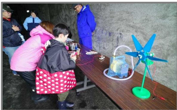
発電おもちゃ体験