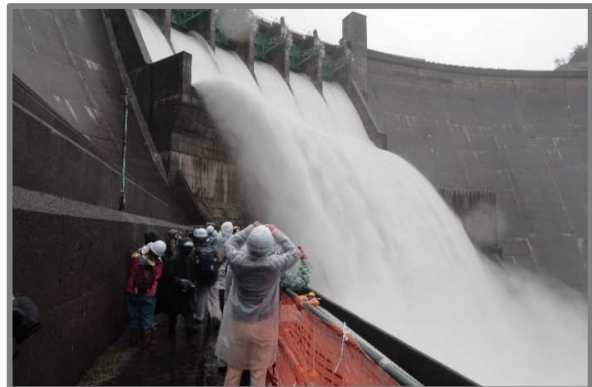
特別見学エリアからの眺め

※②「宿泊者見学プラン」と「JR北上線利用プラン」では、特別見学エリアからの見学ができます。