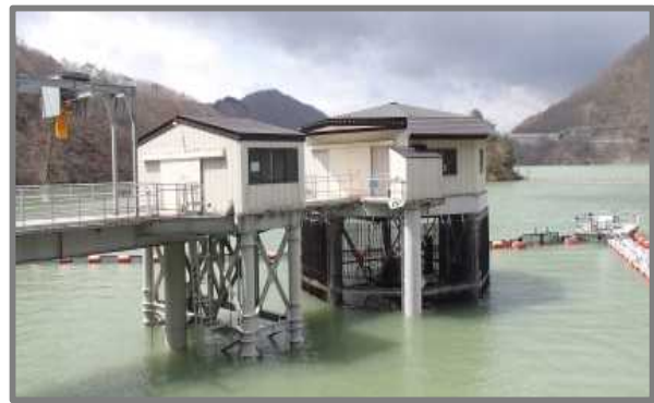
連絡トンネルの先にある発電取水塔