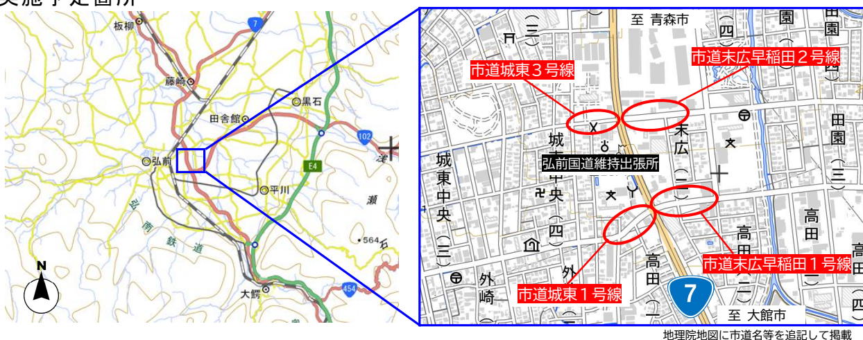
地理院地図に市道名等を追記して掲載

弘前市が雪を市道から国道7号へ押し出し、国が保有するロータリー除雪車でダンプトラックに積み込み、雪捨て場までの運搬を行います。