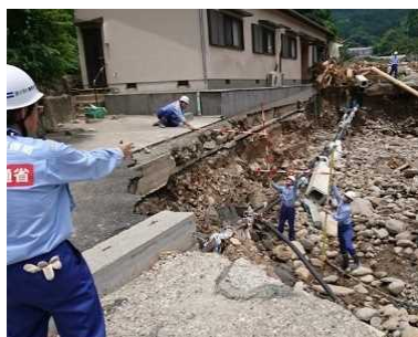
河川被害状況の調査