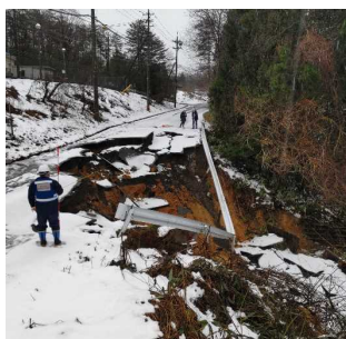
道路被害状況の調査