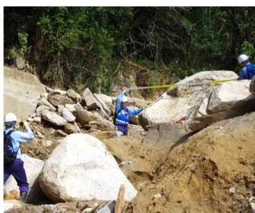
土砂災害被害状況の調査