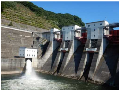
御所ダムからの『非常時補給』状況(7月31日撮影)