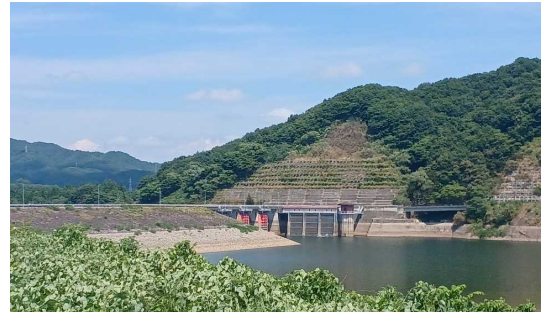
御所ダム貯水池の状況(7月31日撮影)