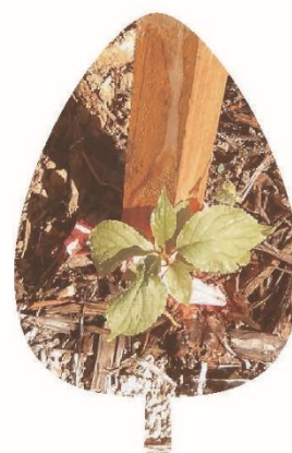
春に植えた幼木 (R5.8.29撮影)

令和8年度完成に向けて建設中の成瀬ダム。工事で使用した土地を森によみがえらせる計画があります。森づくりには、その地域に生息する植物の苗木が必要になります。そのために、工事用地や近くの山から種や幼木を採取して、みんなで苗木になるまで育てていきます。みんなが採取した苗木が、将来、大きくなり、様々な動植物の命を育むなど、大切な「森」になります。本格的な移植を待つ間、森のほいくえんで育てる活動が今年6月から始まりました。