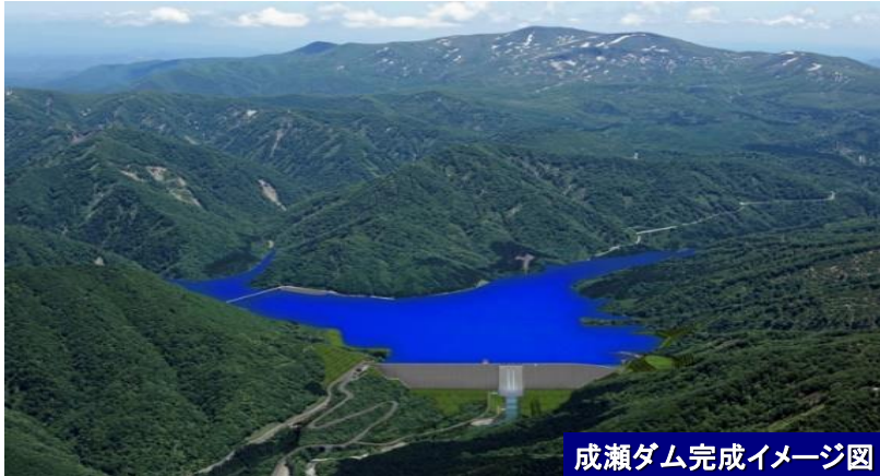
成瀬ダム完成イメージ図