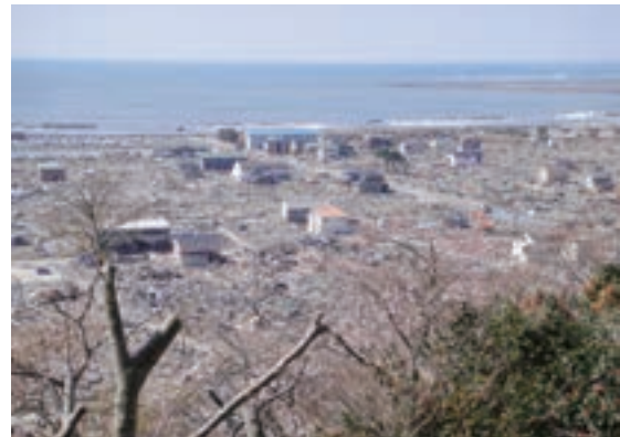
津波襲来後の南浜地区 (2011.4.24 撮影)

震災後、南浜地区の大部分が災害危険区域に指定され、防災集団移転促進事業が進められました。そして跡地の約38.8haに震災復興のシンボルとなる公園を、宮城県・石巻市の都市公園「石巻南浜津波復興祈念公園」として整備することとしました。