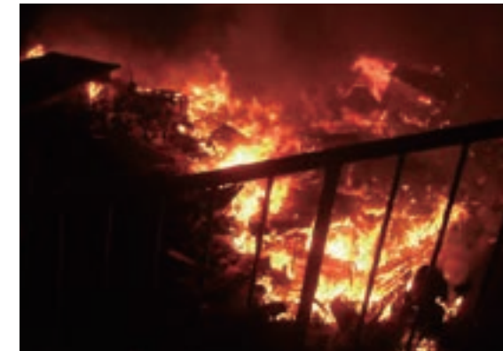
南浜地区(門脇町)に広がる火災の様子 (2011.3.11 撮影)

特に被災の大きかった南浜地区は地震、津波、火災及び地盤沈下の被害を複合的に受けており、東日本大震災の平野部の被災を代表する場所となっています。