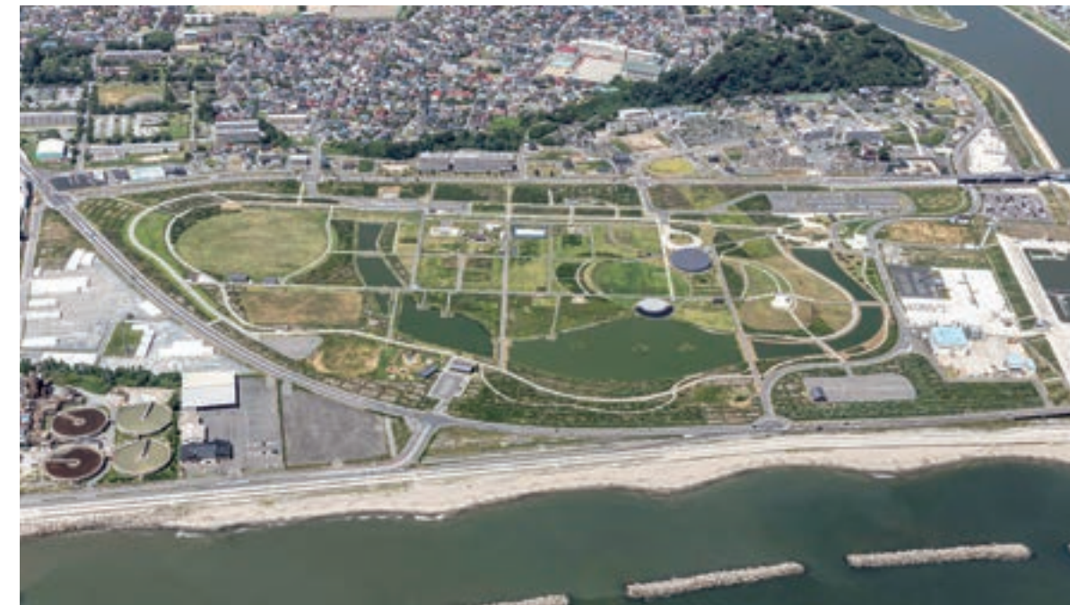
石巻湾から見た現在の南浜地区の様子(2024年8月撮影)

そして、この公園の計画策定にあたっては、国、宮城県、石巻市が連携し、市民や有識者など多くの方々から参画いただきながら、公園計画を策定しました。