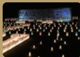
東日本大震災追悼「3.11のつどい」

行政と市民団体が協働・連携し、園内での活動が円滑に行われるよう「参加型運営協議会」が結成され、市民活動・協働の取り組みを実践しています。