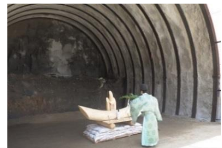
↑7月12日に安全祈願祭を行いました。