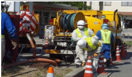
排水管清掃車による側溝清掃

作業は小型清掃車による歩道の清掃および側溝の清掃で、放射線量の測定などをしていました。暑い中で除染作業をしているみなさんは、本当に大変だと思いました。これで、元の校舎で授業が再開できれば、子供たちも喜ぶと思いました。