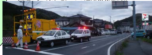
国道49号 三和IC交差点での規制状況