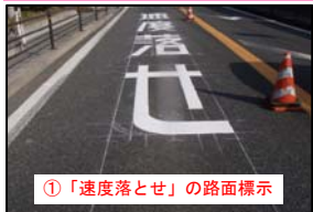
①「速度落とせ」の路面標示