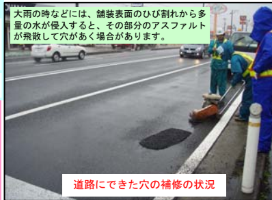
道路にできた穴の補修の状況