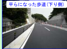
平らになった歩道(下り側)