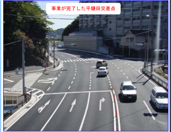
事業が完了した平鎌田交差点

工事期間が長くなり、地元の方々・道路利用者にはご不便とご迷惑をおかけしましたが、皆さまのご協力により事業を完了することができました。