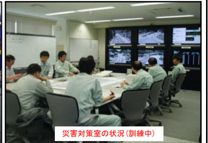
災害対策室の状況(訓練中)