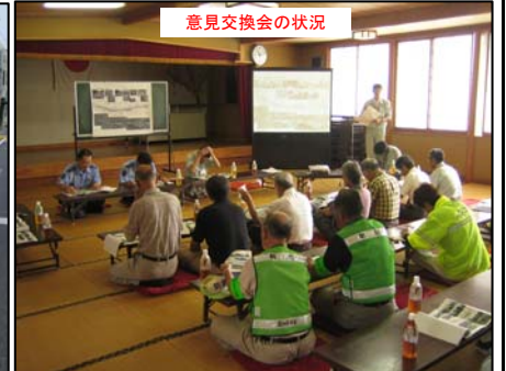
意見交換会の状況