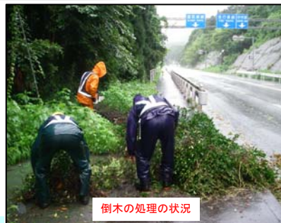
倒木の処理の状況