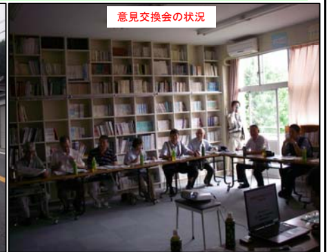
意見交換会の状況