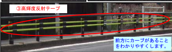
③高輝度反射テープ