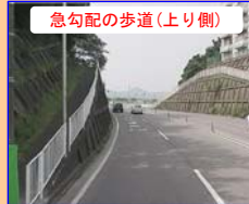
急勾配の歩道(上り側)