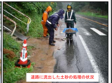
道路に流出した土砂の処理の状況