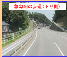
急勾配の歩道(下り側)