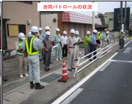
合同パトロールの状況