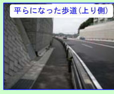
平らになった歩道(上り側)