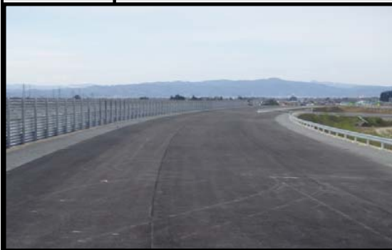
中野地区(山形方向)