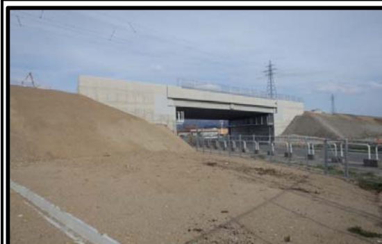
大笹生地区(福島方向)