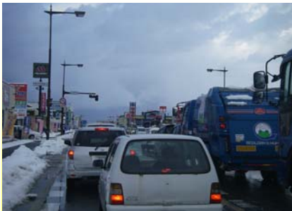
渋滞中の国道7号下り(こあら交差点) 3/11 16:24