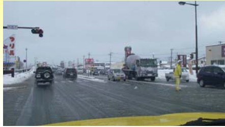
停電により、信号の消えた、国道7号上り (こあら交差点) 3/11 15:31