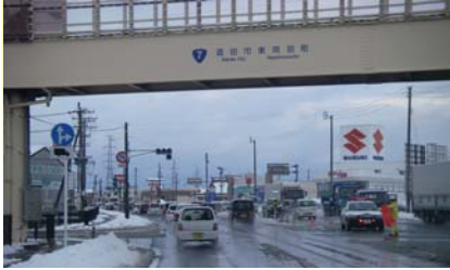
停電により、信号の消えた、国道7号下り (亀ヶ崎横断歩道橋) 3/11 16:13