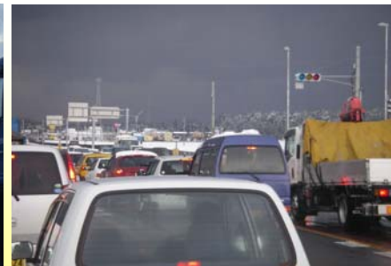
渋滞中の国道7号下り(豊里交差点) 3/11 16:30