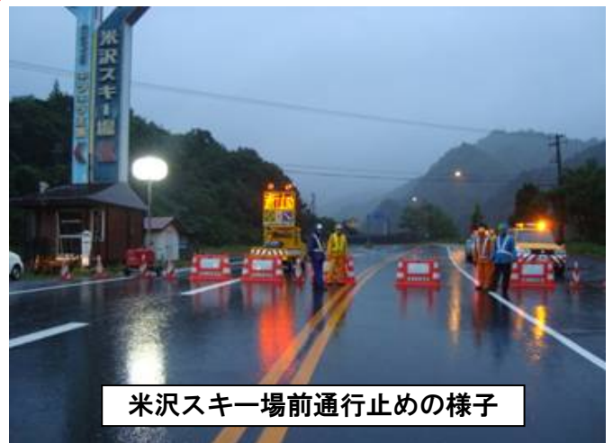
米沢スキー場前通行止めの様子

一度通行止めになると、雨が止んでも、安全パトロールの結果異常がないことを確認しなければ通行可能とすることは出来ません。今回は、特に土砂崩れ等もなく早期の解放となりましたが、ご通行の皆様、沿線の皆様には大変ご不便をおかけしました。