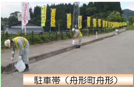
駐車帯(舟形町舟形)