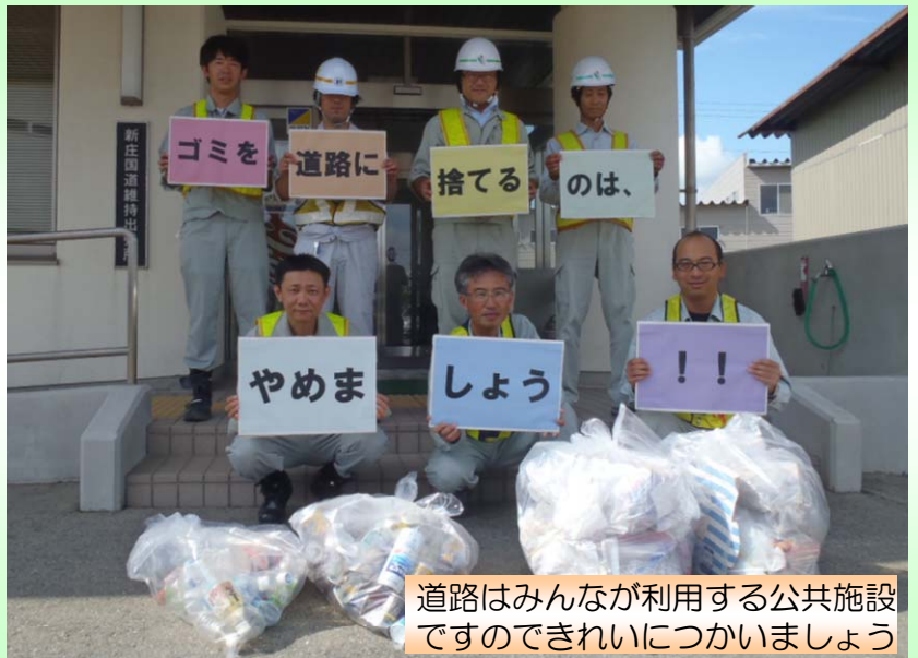
道路はみんなが利用する公共施設ですのできれいにつかいましょう