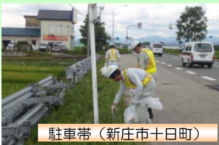
駐車帯(新庄市十日町)